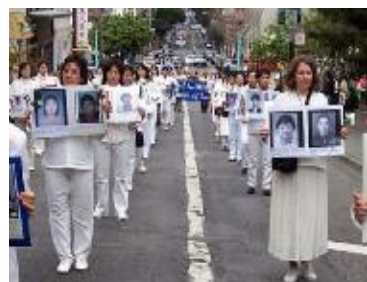
悼念被江氏流氓集团迫害致死的中国大陆法轮功学员