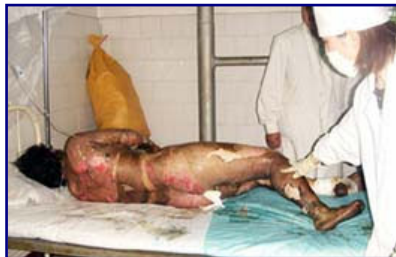
如上图所示：烧伤病人要在空气中晾着，护理人员要穿卫生服，戴口罩以防感染。

【明慧网】我是某修配厂的一名修理工。97年11月3日，我们安装烤漆房时，因电焊工的过失导致油桶爆炸。小焊工当时死亡，我们七人都受了重伤，当时我很严重烧伤深度为3—4度，在某部队的医院进行治疗。深度烧伤住院必须住隔离病房，住无菌室，高度消毒，要有专门的医护人员治疗和护理，医护人员必须穿高温消毒的防护衣和戴消毒口罩，无菌病房绝不允许不穿防护衣的人员踏入一步，并且整个治疗过程都是一丝不挂的，医生说：烧伤以后，身体内部发热，身体表面不能缠绷带，否则，体内的热气、毒气会导致人死亡。