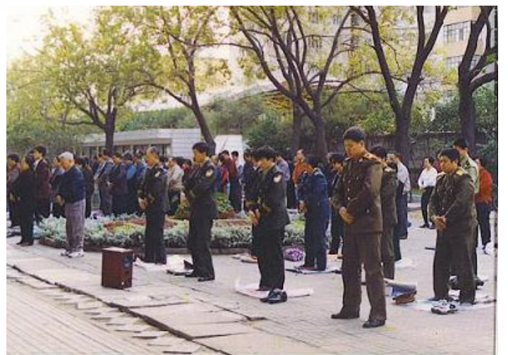
1999年7.20以前 哈尔滨松花江畔集体炼功