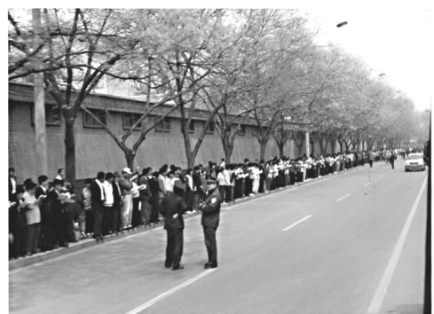
学员没有标语口号 没有阻塞交通警察闲聊