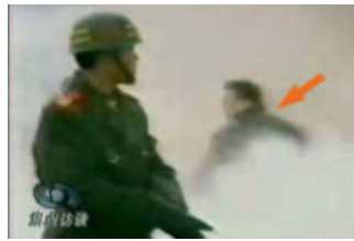
穿着军大衣的凶手(背影)