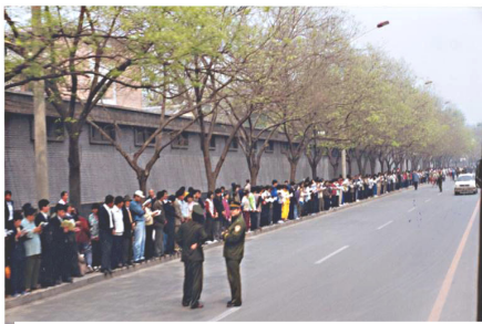
上访学员没有标语口号,秩序井然, 安静平和,没有阻塞交通. 警察无事闲聊天

是警察让我们站在哪儿，就站在哪儿。说我们“攻”，我们都在外面平静地等着临时代表和信访办领导的谈话结果，没有任何过激的言行，没有口号，没有标语，连大声喧哗都没有。”