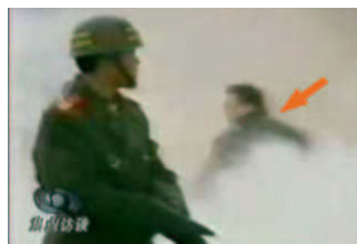
穿着军大衣的凶手(背影)