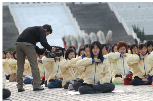
意大利记者在拍摄台湾法轮功学员炼功

【埃塞俄比亚】2005 年 3 月 15 日，埃塞俄比亚人权组织“为了人类行动者协会”（APAP）通过决议，谴责中国政府对法轮功的迫害，并要求立即停止杀戮，停止酷刑折磨法轮功学员，立即释放所有在押的法轮功学员；决议并敦促联合国人权委员会公开发表声明，谴责这场迫害，并要求中国政府立即停止迫害。◇