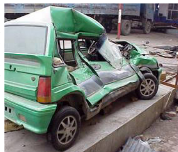
图：车子被撞后严重毁坏