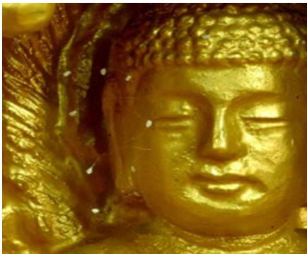
佛像面部开了10朵白色优昙婆罗花

最近韩国出现佛经记载中三千年一开花的优昙婆罗花，成为世人关注的热点。韩国京畿道仪旺市清溪寺冠岳山龙珠寺恋主庵发现此景后，全罗南道顺天市海龙面的须弥山禅院的佛像上又现此花。据佛经记载：优昙婆罗花每3000年开花一次，这种花的出现意味着转轮圣王在末劫时下到人间，不用武力而用正义转动法轮正法，救渡众生。这一异象与今日法轮大法洪传绝非巧合。现在，须弥山禅院高僧终于作出鉴定，并郑重告诉世人：优昙婆罗佛花就在当世千真万确的开了！转轮圣王正在人间正法。