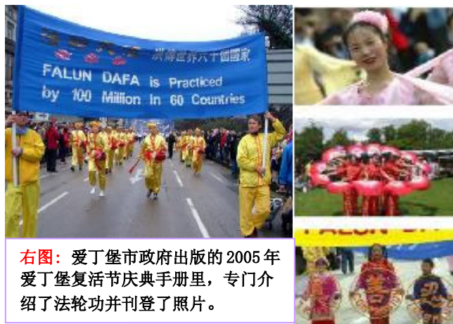
右图：爱丁堡市政府出版的 2005 年爱丁堡复活节庆典手册里，专门介绍了法轮功并刊登了照片。

【明慧网 2005 年 4 月 2 日】每年复活节期间，春暖花开的英国历史名城爱丁堡，聚集了世界各地的人们前来观光旅游度假。爱丁堡市政府举办各种文化演出活动，介绍多元文化以让游人大开眼界，最令人瞩目的活动就是连续两年举办的复活节大游行。法轮功团体也连续两年被邀请参加大游行。