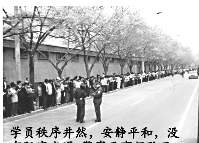
学员秩序井然，安静平和，没有阻塞交通，警察无事闲聊天

“当时我们所在的北京地坛炼功点每天有 500 人炼功，长安街两旁也有很多炼功点。大家天天在一起炼功，谁没有几个熟悉的功友啊？全北京大概有四到五万法轮功学员早上到公园炼功，所以天津抓人的事，大家一大早就都知道了，还有头天晚上就听说了的，大家结伴，三三两两的去。国务院信访办在靠中南海西门那边。说我们“围攻”真是太不公平了。