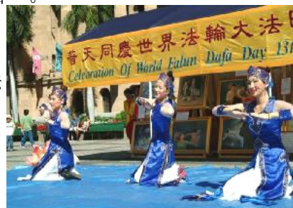
澳洲法轮功学员演出精彩文艺节目

今年5月13日是第六届“世界法轮大法日”，也是法轮大法洪传十三周年的日子。全世界法轮功学员以各种方式庆祝这大法福泽众生的日子。