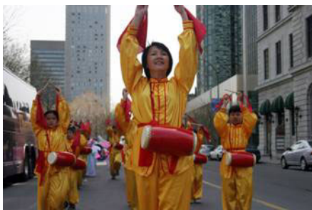
加拿大蒙特利尔街市响彻了欢庆的腰鼓

联合国“信仰自由”、“促进保护言论自由”、“酷刑问题”等七位人权特派专员已联合向中国政府写信表达他们对法轮功的关切，针对很多迫害案例，他们已向中国政府提出质疑，并收录于特派专员递交给各国政府及联合国人权委员会的报告中。专员们特别关注有关对法轮功学员的逮捕、拘留、虐待、酷刑、拒绝提供足够的医药治疗、性暴力、致死和不公正审判等。◇