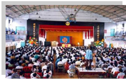
李老师台北三兴國小讲法现场

1996 年 11 月和 1997 年 2 月，数十位台湾学员两次组团到北京参加修炼心得交流会，和北京的学员进行为期九