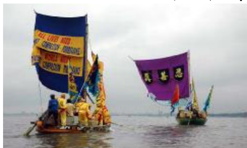
印度尼西亚法轮功学员庆祝世界法轮大法日。创意新颖的锦旗船舟，海堤腰队，……