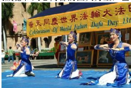
澳大利亚法轮功学员演出精彩节目

今年 5 月 13 日是第六届“世界法轮大法日”，全世界法轮功学员以各种方式庆祝这大法福泽众生的日子。