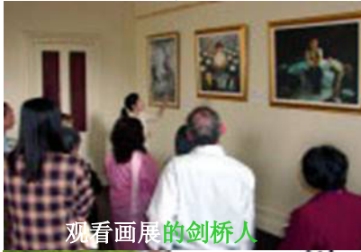
观看画展的剑桥人

此次参展作品的作者都是法轮功学员，其中四人曾直接遭受残酷迫害。一位从国内来探亲的老人深有感触的说：“这个画展办得太好了，它真实的揭露了中国发生的迫害，法轮功的人真了不起啊！”