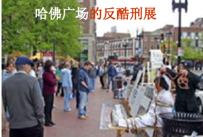
哈佛广场的反酷刑展

每年四、五月之交，哈佛大学的中国大陆学生社团“哈佛中国评论”都会举办一年一度、以中国为主题的大型研讨会。每次都吸引很多华裔精英和西方人士。今年在此期间，熙熙攘攘的哈佛广场上，法轮功学员举办的反酷刑展吸引了哈佛人，不断有师生说：“前一两次就看到了，实在太震撼了。”