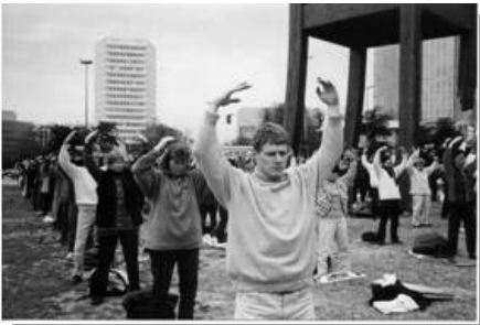
图：03年3月日内瓦万国广场