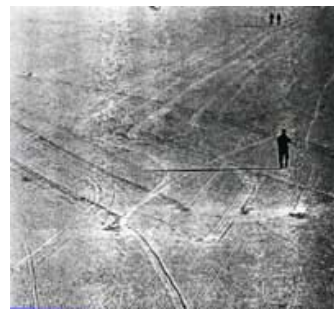
图三：Reid 教授研究的石头移动轨迹，他发现如果是风吹动石头，风速应高达每小时500英哩[3]

夏普教授除了观察石头移动的痕迹之后，并选了三块形状、大小不一样的石头，逐一起贴上卷标，并在原来的位置旁边打下金属桩作为记号，结果发现除了有两块还留在原位之外，其余的都离开了原来的位置。虽然夏普教授认定石头的移动是风雨的作用，可是在1990年麻州汉斯尔学院（Hampshire College in Massachusetts）的教授约翰·雷德（John Reid）带领一群人重新回到死谷测量，结果推翻了夏普教授的理论。因为他们发现要移动任何一颗不怎么大的石头都需要至少时速是500英哩的风速，但是在地球上根本就没有任何地方能产生这么大的风速。因此，为什么石头会自己移动？至今仍然科学上是解不开的谜。