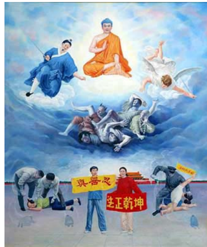
王志平，《正邪大战》， 油画，66 英寸 x 79 英寸 (2003 年)

这幅画表现了当高层空间的邪恶操纵人间的恶警对修炼真善忍做好人的法轮功弟子进行迫害时，正神将清除邪恶烂鬼，行天理正人道。天网恢恢，疏而不漏。