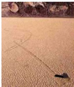
图二：行径曾经大转弯的石头。（图片来自

http://www.anomalies-unlimited.com/OddPics/Playa.html ）