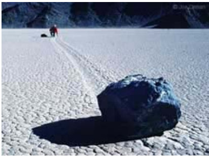
图一：重达七百磅的巨石在加州的死谷公园（California's Death Valley National Park）移动了数百尺。（图片来自

【明慧学校】】《佛祖统纪》中记载的石头听高僧讲经点头表示认同的故事发生在古代，而现今神奇古怪的石头也不少，例如在美国的死谷（Death Valley）的一个已干涸的湖形成的路道（Racetrack Playa）上就有着许多会自行移动的石头（Moving Rocks）[1]。