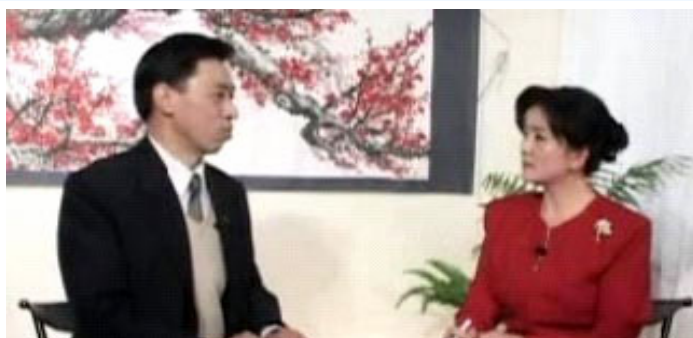
已定居美国的关贵敏接受海外华语电视台专访

国家一级演员关贵敏在七十年代后期的[浪花里飞出欢乐的歌]，[青春啊，青春]等歌曲享誉全中国。如今已年届60岁的他仍保持着八十年代舞台上的形象。嗓音比以