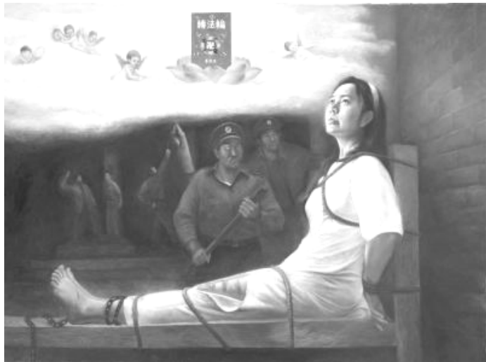
李进宇 《无畏》油画，48 英寸 x 36 英寸 (2005)

画面展现的是法轮功学员在经受酷刑前的一瞬间，恶警拿着电棍将向这位年轻而无辜的姑娘下毒手。画中的女法轮功学员受刑前的面部表情坦然安详，是因为她对真善忍的坚信，心中因此充满了光明。