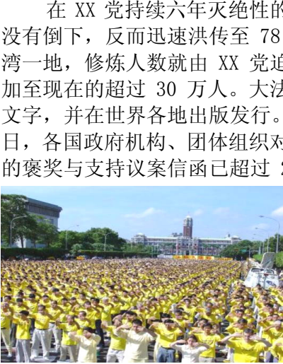
台湾法轮功学员在集体炼功

1995 年 3 月和 5 月，李洪志先生应邀到法国和瑞典传功讲法，开始了法轮大法在海外的传播，给中国赢得巨大国际声誉。