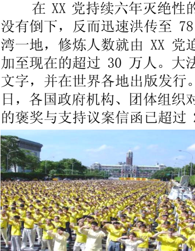
台湾法轮功学员在集体炼功

1995 年 3 月和 5 月，李洪志先生应邀到法国和瑞典传功讲法，开始了法轮大法在海外的传播，给中国赢得巨大国际声誉。