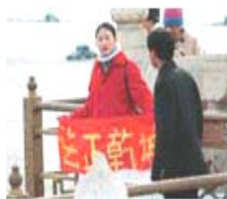
中国学员天安门和平请愿