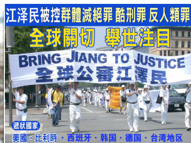
全球公审江泽民大游行