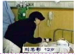
中央台“天安门自焚案”中的“烧伤病人”

人们在对此次受难者深表关切的同时，细心者更是从新闻报道中恍然大悟，发觉四年前 CCTV 曾大肆报道的所谓“天安门自焚案”确实大有蹊跷。大家都知道一个基本常识：“烧伤后不能用药布包