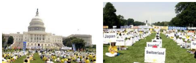
美国国会山庄大集会

【明慧网】2005 年 7 月 21 日，上千名来自世界不同国家的法轮功学员汇集在美国首府华盛顿 DC，以集会、游行和烛光守夜等各种方式，揭露和谴责中共迫害法轮功的恶行，同时呼吁各界制止中共的恐怖主义行为，结束这场仍在继续的对法轮功的迫害。