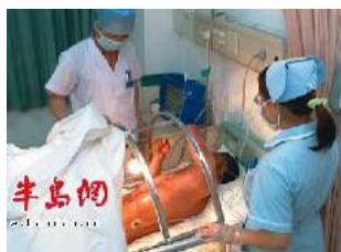
图一：青岛闪电烧伤病人在抢救中

图一为被闪电击中烧伤的病人在医院病房中接受抢救的图片。而图二是 2001 年曾被中央电视台播出的“天安门自焚案”中烧伤者及其接受采访图片，细心的读者，对比两组图片，您能发现什么问题吗？