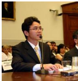
前外交官陈用林在美国会作证

7 月 21 日陈用林对美国国会众议院的一个委员会说，他在担任中共驻澳大利亚悉尼总领事馆政治领事期间，专门负责中共当局压制那个地区法轮功的工作。他说，中共当局在澳大利亚驻有多达 1 千名安全人员，这些人参与了迫害和监控在那里的法轮功学员的行动。