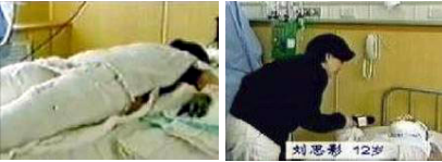
“天安门自焚案”中的“烧伤病人”

重度烧伤病人最大的危险就是细菌感染。所以在全世界所有现代的医院里面，都要把这种病人放入特殊的无菌病房。可是 2001 年 1 月，中央电视台“天安门自焚案”中的记者却不穿卫生服，不戴口罩，就拿着话筒近距离采访“大面积烧伤”的小女孩。这又说明了什么呢？