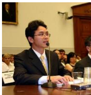
前外交官陈用林在美国会作证

7 月 21 日陈用林对美国国会众议院的一个委员会说，他在担任中共驻澳大利亚悉尼总领事馆政治领事期间，专门负责中共当局压制那个地区法轮功的工作。他说，中共当局在澳大利亚驻有多达 1 千名安全人员，这些人参与了迫害和监控在那里的法轮功学员的行动。