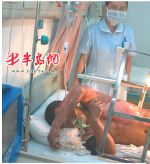
青岛闪电烧伤病人

一个诚实善良、技术过硬的农技师就这样被恶党江氏集团的爪牙多次非法绑架、关押、迫害。