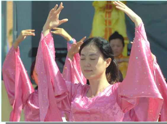
美国费城地区法轮功学员作功法演示

【明慧网】“Gorgeous！（表演得棒极了！）”当法轮功学员的游行队伍走过主席台时，观众们情不自禁的鼓掌赞叹着。这是2005年9月3日（星期六）美国宾州州参议员安东尼·威廉姆斯举行的一年一度的好邻里街头节日庆祝活动，今年是第16届。美国大费城地区法轮功学员应邀参加了游行及舞台表演，向观众展示了中国传统的狮子舞，扇子舞和腰鼓，及法轮功功法。