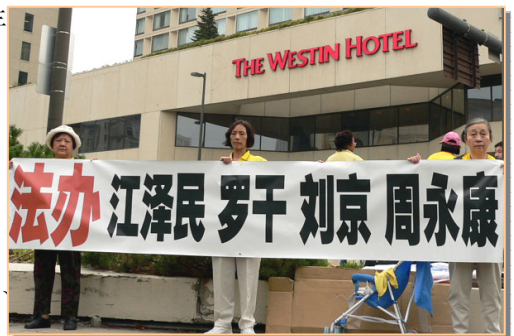
法轮功学员在胡锦涛下榻的WESTIN酒店前请愿

【明慧网】2005年9月8日上午，胡锦涛率团在暴风雨中抵达加拿大首都渥太华。来自加拿大各大城市和美国部份城市的数百名法轮功学员在机场、胡下榻的旅馆和总督办公室等地，打出“严惩江泽民、