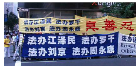
在胡下榻的酒店门前请愿

2005 年 9 月中旬联合国成立六十周年各国元首高峰会议之际，法轮功学员在纽约联合国总部前，呼吁各国元首和公众关注发生在中国对法轮功的残酷迫害，告诫参加联合国大会的中国国家主席胡锦涛不要继续江泽民的迫害政策，应立即停止迫害，释放所有被关押的法轮功学员。