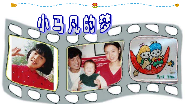
图从左至右：小马凡、马凡和父母、马凡的手工贴画

2005 年 3 月 6 日，高蓉蓉不幸再遭绑架，并被秘密关押。6 月 16 日高蓉蓉死于“医大”急诊室，年仅 37 岁。此前有关她的信息一直被严密封锁。营救高蓉蓉的女法轮功学员董敬哲、张立荣、董敬雅、马廉晓被关押在马三家教养院，男学员孙士友、吴俊德、刘庆明、马玉平被关押在沈新教养院遭迫害。◇