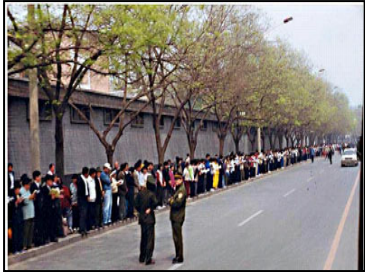
上访学员安静祥和， 警察没事，闲聊天。

法轮功学员“4.25”上访，去国务院信访办伸冤，是符合宪法的和平上访，是出于对政府的信任，