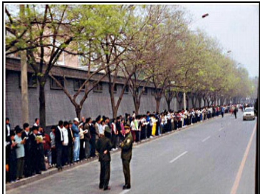
上访学员安静祥和， 警察没事，闲聊天。

法轮功学员“4.25”上访，去国务院信访办伸冤，是符合宪法的和平上访，是出于对政府的信任，