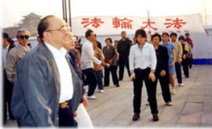
绍祖亲赴法轮功发祥地长春考察。