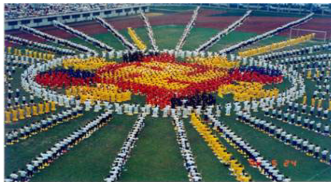
1996年，武汉，约5000名法轮功学员集体炼功，列队组成辉煌的法轮图形

【明慧网】法轮大法自1992年5月从长春传出至今，已经传遍亚太地区、北美、南美、欧洲绝大部分地区，以及非洲的部份国家，据不完全统计，法轮大法已洪传近80个国家（地区）。在全世界，不同种族肤色的法轮功修炼者已超过一亿，法轮大法主要著作《转法轮》等，已被翻译成30种语言在世界各地出版发行，法轮大法因其“真善忍”法理带给世界的美好，收到世界各国政府机构、议员、团体组织等对法轮大法和创始人的褒奖、支持议案和信函已达2592项。