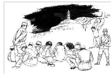
延安整风

延安整风运动是人中最恐怖、最黑暗、最残暴的权力游戏。以整肃小资产阶级毒素的名义，党清洗着人的文明、独立、自由、容忍、尊严等价值。整风的第一步，是建立每个同志的人事档案，包括（1）自我概述，（2）政治文化年谱，（3）家庭成份与社会关系，（4）个人自传与思想变化，（5）党性检讨。