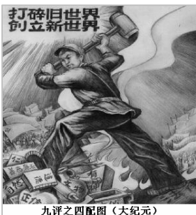
九评之四配图

而近百年来，共产幽灵的轰然入侵，形成了一股违背自然，违背人性的力量，造成了无数的痛苦和悲剧，也将人类文明推到了毁灭的边缘。其叛“道”