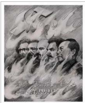
九評之一配图

如果說，奪取政權的戰爭中暴力無可避免，那麼世界上從來沒有象共產黨這樣的在和平時期仍然酷愛暴力的政權。1949年之後，中共暴力殘害