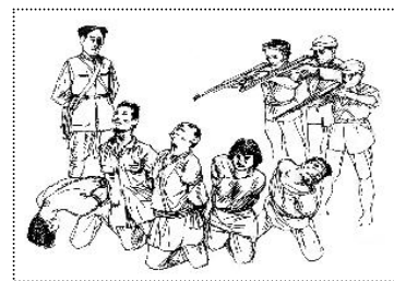
苏区肃反

这种“镇反”和“土改”有几个最直接的功效：第一、过去中国的基层权力组织基本属于乡村宗族自治，乡绅成为地方的自治领袖，中共通过“镇反”和“土改”杀光了原有体系的管理人员，实现其“村村都有党支部”的农村全面控制；第二、通过土改和镇反抢劫大量钱财；第三、通过对地主富农的残酷镇压达到震慑百姓的效果。