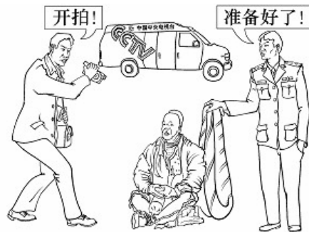
自焚骗局(大纪元配图)

最为恶劣的，是在 2001 年 1 月导演了一场所谓的“自焚”闹剧，并通过新华社以从未有过的速度向全世界散播，嫁祸法轮功。这场闹剧，后被包括服务于联合国的国际教育发展组织（IED）在内的多个国际组织认定为虚假编造。在面对质询的时候，一名参与制作电视节目的工作人员辩称，中央电视台所播放的部分镜头，是“事后补拍”的，镇压者的流氓本性暴露无遗。人们不禁发出疑问，那些“视死如归的法轮功弟子”，怎么会和中共当局如此合作？