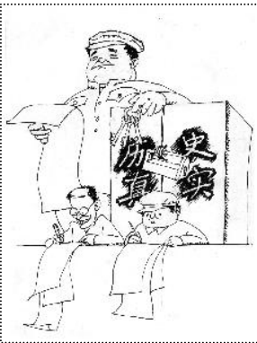
伪造历史、掩盖真实、进行洗脑是中共的一贯伎俩。

事实上，中共无孔不入的统治方式，让我们的文化，我们的思维方式，甚至判断中共的标准，都深深打上了中共的烙印，甚至就是中共的那一套。如果说过去是靠灌输来控制人们的思想，现在就是中共收获的时候了。因为那些灌输的东西已经被消化，已经演变成人们自己的细胞，人们自己就会主动按照中共的逻辑去思考，去设身处地从中共的角度出发来论证事情