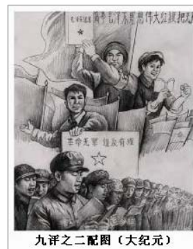
九评之二配图

在具有五千年文明历史的中国，要移植进来一个与中国传统格格不入的共产党，引入一个外来邪灵，实在不是一件简单容易的事情。中共用共产主义的大同思想欺骗民众和爱国无门的知识分子，又进一步歪曲已被列宁严重歪曲了的共产主义理论，以此为依据，摧毁一切不利于它的统治的