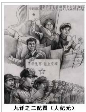
九评之二配图

在具有五千年文明历史的中国，要移植进来一个与中国传统格格不入的共产党，引入一个外来邪灵，实在不是一件简单容易的事情。中共用共产主义的大同思想欺骗民众和爱国无门的知识分子，又进一步歪曲已被列宁严重歪曲了的共产主义理论，以此为依据，摧毁一切不利于它的统治的