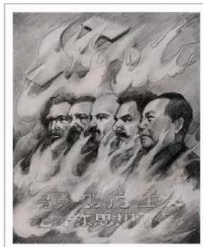
九評之一配图

如果說，奪取政權的戰爭中暴力無可避免，那麼世界上從來沒有象共產黨這樣的在和平時期仍然酷愛暴力的政權。1949年之後，中共暴力殘害