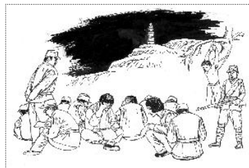
延安整风

延安整风运动是人中最恐怖、最黑暗、最残暴的权力游戏。以整肃小资产阶级毒素的名义，党清洗着人的文明、独立、自由、容忍、尊严等价值。整风的第一步，是建立每个同志的人事档案，包括（1）自我概述，（2）政治文化年谱，（3）家庭成份与社会关系，（4）个人自传与思想变化，（5）党性检讨。