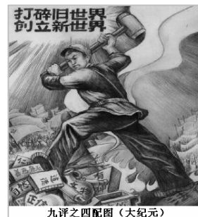
九评之四配图

而近百年来，共产幽灵的轰然入侵，形成了一股违背自然，违背人性的力量，造成了无数的痛苦和悲剧，也将人类文明推到了毁灭的边缘。其叛“道”