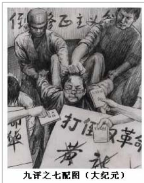
九评之七配图

既然是为制造恐怖而杀人，那么杀谁不杀谁也就毫无理性可循。在历次政治运动中，中共从来都是使用“群体灭绝”政策。以“镇压反革命”为例，中共并非镇压反革命“行为”，而是镇压反革命“分子”。即使一个人只是被抓丁当了几天国军，并且在中共建政后什么也没做，一样要处死，因为他属于“历史反革命”。在土改过程中，中共甚至有时会采取“斩草除