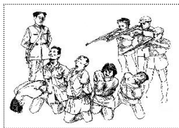
苏区肃反 (大纪元配图)

这种“镇反”和“土改”有几个最直接的功效：第一、过去中国的基层权力组织基本属于乡村宗族自治，乡绅成为地方的自治领袖，中共通过“镇反”和“土改”杀光了原有体系的管理人员，实现其“村村都有党支部”的农村全面控制；第二、通过土改和镇反抢劫大量钱财；第三、通过对地主富农的残酷镇压达到震慑百姓的效果。