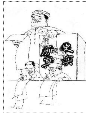
伪造历史、掩盖真实、进行洗脑是中共的一贯伎俩。

事实上，中共无孔不入的统治方式，让我们的文化，我们的思维方式，甚至判断中共的标准，都深深打上了中共的烙印，甚至就是中共的那一套。如果说过去是靠灌输来控制人们的思想，现在就是中共收获的时候了。因为那些灌输的东西已经被消化，已经演变成人们自己的细胞，人们自己就会主动按照中共的逻辑去思考，去设身处地从中共的角度出发来论证事情