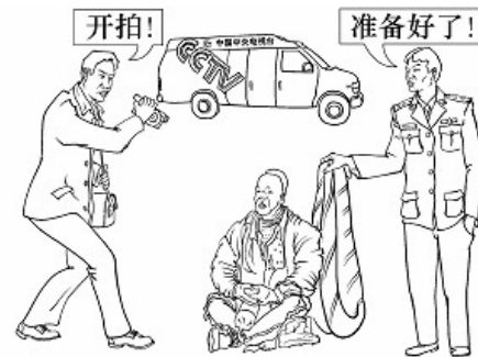
自焚骗局

最为恶劣的，是在 2001 年 1 月导演了一场所谓的“自焚”闹剧，并通过新华社以从未有过的速度向全世界散播，嫁祸法轮功。这场闹剧，后被包括服务于联合国的国际教育发展组织（IED）在内的多个国际组织认定为虚假编造。在面对质询的时候，一名参与制作电视节目的工作人员辩称，中央电视台所播放的部分镜头，是“事后补拍”的，镇压者的流氓本性暴露无遗。人们不禁发出疑问，那些“视死如归的法轮功弟子”，怎么会和中共当局如此合作？