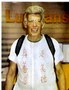
瑞姆 T 恤上的“真善忍是美德”清晰可读

法轮功修炼者在中国几年来遭受迫害、抓捕、酷刑，三千多人被谋杀。瑞姆先生说“名誉上臭，经济上搞垮，肉体上消