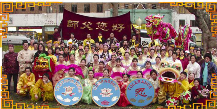
▲参加游行的学员合影 给师父拜年

成千上万的手折莲花与真相小册子散发给观众，小册子的内容是介绍法轮功，以及目前仍在中国发生着的中共残酷迫害法轮功的真相。许多中国人接到了有关迫害真相的光盘，许多西方人也表示想要与他们的中国朋友和邻居分享这些信息。