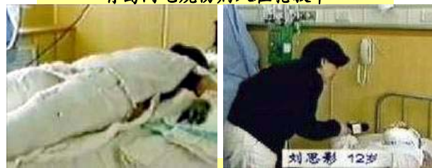
中央台“天安门自焚案”中的“烧伤病人”受采访

人们在对此次受难者深表关切的同时，细心者更是从新闻报道中恍然大悟，发觉四年前 CCTV 曾大肆报道的所谓“天安门自焚案”确实大有蹊跷。大家都知道一个基本常识：“烧伤后不能用药布包裹着烧伤部位。”可是中央电视台“天安门自焚案”中的“烧伤病人”整个身体却被严密包裹着，究竟要掩盖什么呢？