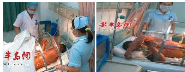
青岛闪电烧伤病人在抢救中

床上方有专门的金属罩，用来把遮盖物与烧伤身体隔开，使烧伤处暴露在空气中晾着。护理人员身穿卫生服，戴口罩以防感染。