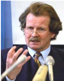
联合国酷刑问题 特派专员曼夫德- 诺瓦可先生

【明慧网】联合国“酷刑问题”赴中国特派专员结束了两个星期实地调查，2005 年 12 月 2 日在北京召开新闻发布会，世界各大媒体相应抢播报道。由于国际社会的压力，这是联合国以及国际社会对中国进行的第一次正式的人权与酷刑问题的实地检查。在 12 月 2 日的北京新闻发布会上，特派专员谴责酷刑问题在中国非常普遍，而且滥用酷刑遍及全国，中国政府应该遵循国际人权基本准则，以及联合国宪章。中国有着世界上最大的