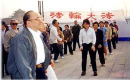
图为98年5月15日伍绍祖亲赴法轮功发祥地长春考察。

1998年，体总组织北京、武汉、大连及广东省的医学界专家，对近三万五千名法轮功学员所做的五次医学调查表明，修炼法轮功祛病健身的有效率高达98%以上。国家体总统计，全国学炼法轮功超过七千多万之众。