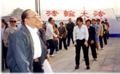
图为98年5月15日伍绍祖亲赴法轮功发祥地长春考察。

1998年，体总组织北京、武汉、大连及广东省的医学界专家，对近三万五千名法轮功学员所做的五次医学调查表明，修炼法轮功祛病健身的有效率高达98%以上。国家体总统计，全国学炼法轮功超过七千多万之众。