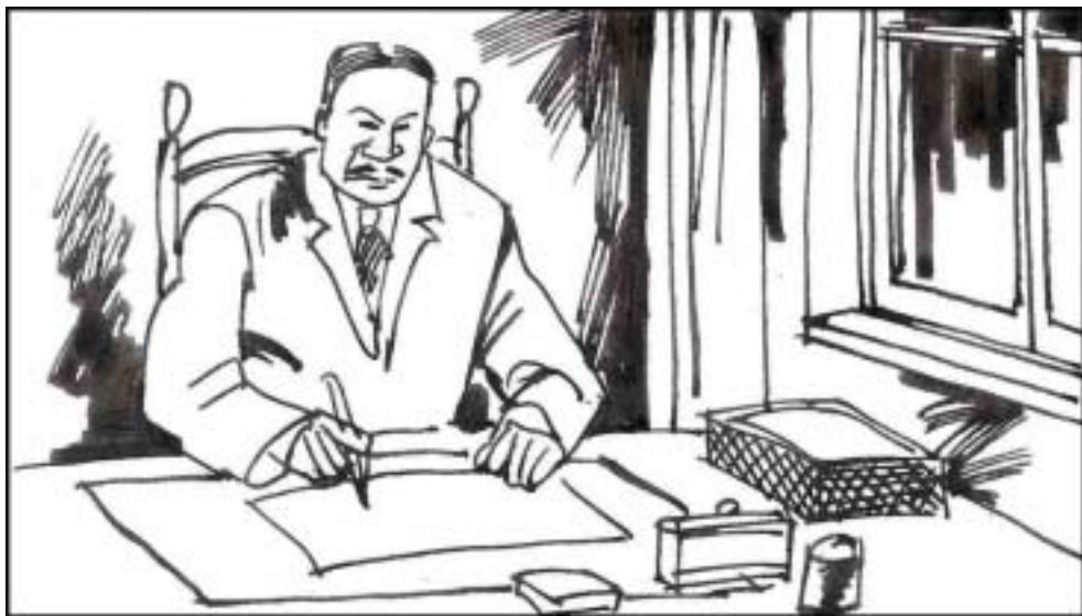
3. 江世俊担任伪政府宣传部副部长兼社论委员会主任委员，是伪政府《中华日报》主笔著名的汉奸作家胡兰成的得力部下。他怕有朝一日抗战胜利承担罪责，改名“江冠千”。