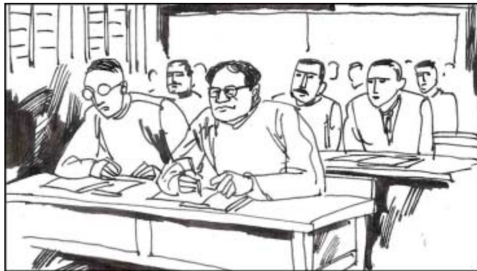
10. 为了让长子江泽民将来出人头地，江世俊不但送他去学费不菲的扬州中学，还送他去南京的汪精卫伪政府办的伪中央大学读书。当时在日本占领区的中国百姓连温饱都不能保证，他却在用贼父卖国的钱上贵族学校。