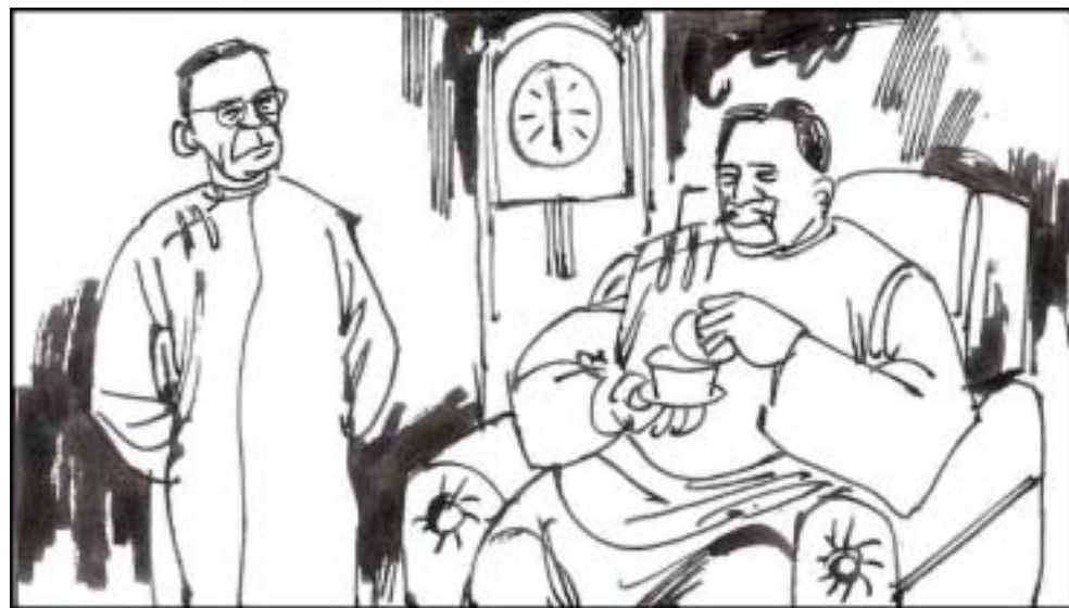
12. 江世俊每日“公务繁忙”，但是还总花时间对江泽民“谆谆教导”。江泽民早熟，还天生一肚子坏水儿，学习贼父这套系列麻醉洗脑技术，一说即通，一点就会。