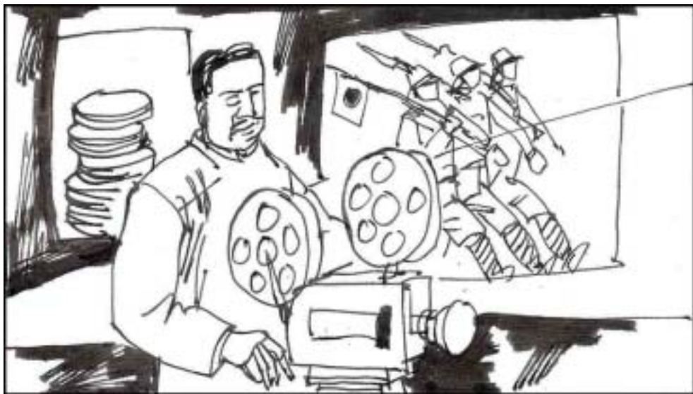
5. 江世俊策划了“大东亚圣战太平洋战绩展”，利用声光演示日美之间的空战和海战，宣扬日军武士道侵略精神，以及“天照大神”保佑的“武运长久”，让观众以为侵华日军不可战胜。