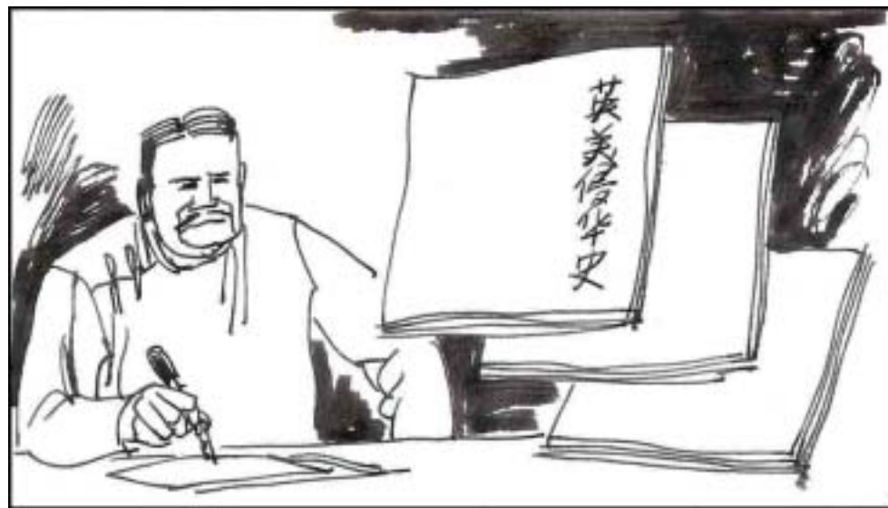
8. 负责日伪宣传部的江世俊为了转移中国民众对侵华日军的刻骨仇恨，创编儿童歌曲、编造连环画《英美侵华史》，对儿童灌输对英美的仇视，歌颂“大东亚共荣圈”，抹煞日军侵略中国，屠杀中国人民的罪行。