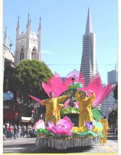
花车上演示法轮功功法

法轮功队伍以天国乐团打头阵，演奏了“法轮大法好”等乐曲，随后是花车、炼功队及明慧学校小弟子表演的剑舞。沿途观众有的跟着乐团吹奏的乐曲，和着拍子而舞动，有的欢呼鼓掌，有的在学法轮功学员的炼功动作。有明白真相的观众说：“停止迫害法轮功！”游行组委说：“旧金山的每个游行活动，都应邀请法轮功参加，法轮功是不可缺少的团体。”