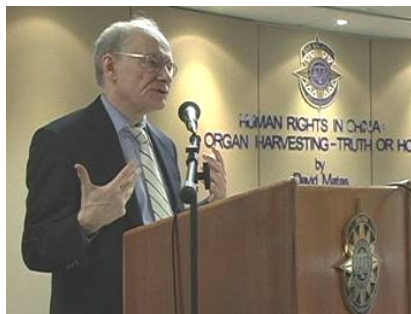
麦塔斯在马来西亚律师公会礼堂报告调查结果

中共曾经向奥委会承诺在零八年奥运举办前改善人权，但上月国际特赦协会公布的人权报告谴责中共的人权非但没有改善，而且继续恶化。◇