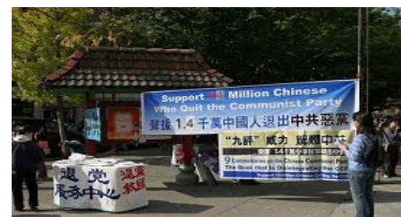
▲在美国华盛顿州西雅图退党服务中心发起了声讨中共暴行的集会。

当今，中共已是罪恶累累，天欲灭之。当您听到大法弟子们劝您快读《九评》、“三退”（退党、团、少先队）自救时，有缘的人们哪，相信大法弟子所言就会和上边故事里的善心富人一样得救了。因为读《九评》，行“三退”就能解脱中共邪魔魔障，远离恶魔，祸不上身。“救人”，这是大法弟子们唯一的心愿。◇