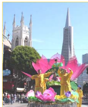
花车上演示法轮功功法

【明慧网】二零零六年十月八日，美国旧金山第一百三十八届哥伦布节庆典游行隆重举行，在参加游行的一百三十个团体中，法轮功团队受到了主办单位和沿途观众的热烈欢迎。据主办方估计，当日约有四十万观众。