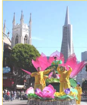
花车上演示法轮功功法

【明慧网】二零零六年十月八日，美国旧金山第一百三十八届哥伦布节庆典游行隆重举行，在参加游行的一百三十个团体中，法轮功团队受到了主办单位和沿途观众的热烈欢迎。据主办方估计，当日约有四十万观众。