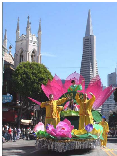
花车上演示法轮功功法

法轮功队伍以天国乐团打头阵，演奏了“法轮大法好”等乐曲，随后是花车、炼功队及明慧学校小弟子表演的剑舞。沿途