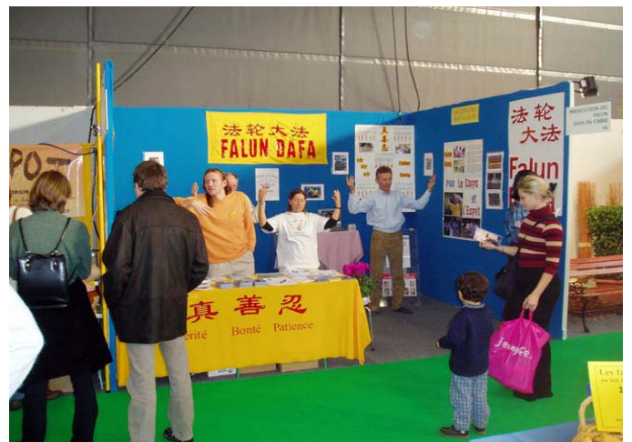
在法国格勒诺布尔市介绍法轮功