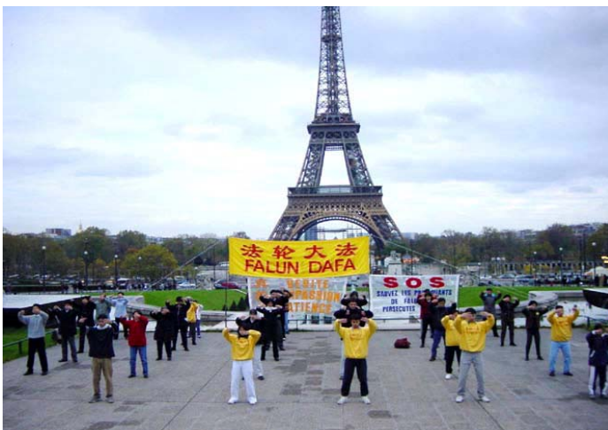
法轮功学员在法国巴黎埃菲尔铁塔下炼功

的第一个国家。从那时起，这个以修炼真、善、忍为根本的，加以五套动作相辅的功法——法轮功传播到了世界上八十多个国家和地区，修炼者曾达一亿人之多。