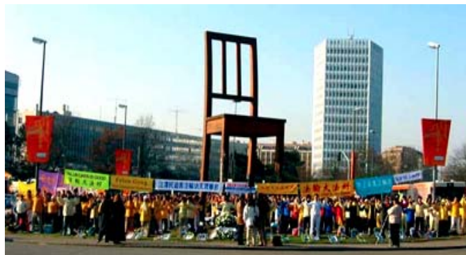
来自全球的法轮功学员在联合国前讲真相

访，并向公众揭露中共活体摘取法轮功学员器官内幕。薄熙来在其任职辽宁省长期间参与了对法轮功修炼团体的迫害，包括对法轮功学员的活体器官摘取罪行。抗议活动引起路人关注。