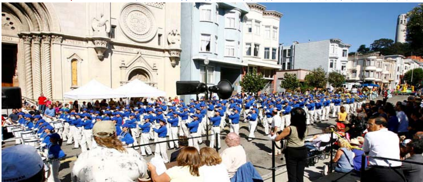
海滩市海洋节游行法轮功再展风采