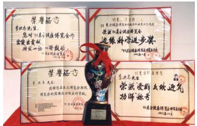
法轮功创始人在九三年东方健康博览会上的获奖证书