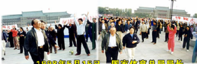
1998年5月15日，国家体育总局局长伍绍祖亲赴法轮大法发祥地长春考察

1998年国家体育总局对广东省万余名法轮功学员的调查结果是：法轮功祛病健身总有效率高达97.9%。1998年下半年，由前人大委员长乔石所主持的对法轮功的官方调查得出的结论是：法轮功于国于民有百利而无一害。◇