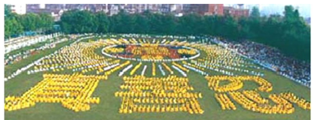
湖北省武汉市，5000 多法轮功学员集体炼功，组成“法轮图形”和“真善忍” ---1997