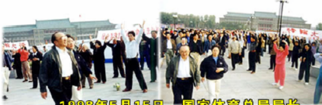
1998年5月15日，国家体育总局局长伍绍祖亲赴法轮大法发祥地长春考察

1998年国家体育总局对广东省万余名法轮功学员的调查结果是：法轮功祛病健身总有效率高达97.9%。1998年下半年，由前人大委员长乔石所主持的对法轮功的官方调查得出的结论是：法轮功于国于民有百利而无一害。◇