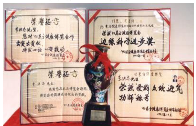
法轮功创始人在九三年东方健康博览会上的获奖证书