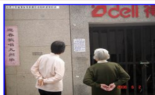
江苏淮安市家属区的退党标语