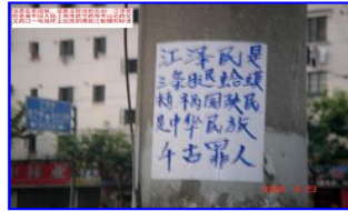
美国贼、迫害法轮功学员的元凶——江泽民在上海市的老巢附近的揭批标语