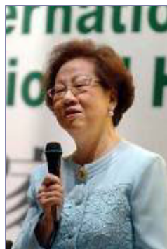
▲吕秀莲表达了对中共活摘器官真相的关切

如众所知，法轮功在中国大陆受到中共的残酷迫害，而海峡对岸同样承传华夏文化的台湾，十余年来，台湾法轮功学员从几百人增加到三十多万人，近千个炼功点遍及各地，甚至远达离岛。各级政府及各政党也非常肯定法轮功净化人心、改善人民身体健康的成果，从总统、副总统，历任行政院长、立法院院长、台北市市长、多位县市市长及县市市议员、各县市的立委等均多次表示对法轮功的支持。◇