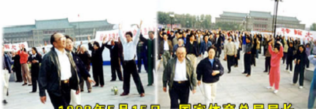
1998年5月15日，国家体育总局局长 伍绍祖亲赴法轮大法发祥地长春考察