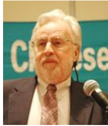
加拿大著名律师 科来福·安世立

安世立举例说：“一次，一个人在南京一家著名的面馆使用的配料里下了老鼠毒药。面馆的客人因此而死亡。在逮捕这个被告人的报告里，以及针对他的审判书中，没有任何有关法轮功的内容。但是，当电视等媒体报导他的死刑时，报导中有一个简短的声明，声称此