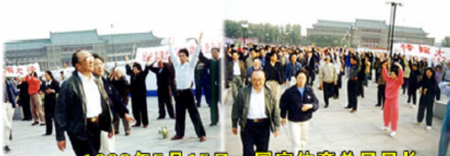
1998年5月15日，国家体育总局局长 伍绍祖亲赴法轮大法发祥地长春考察