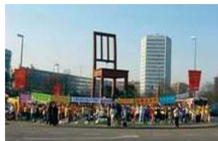
全球法轮功学员在联合国前讲真相

中共企图阻止在人权理事会上讨论“关于中共摘取法轮功修炼者人体器官的问题”，但是没有成功。这次在日内瓦举行的会议于十月六日结束。一些联合国的报告员将参与对此事的调查，并向联合国作出报告。