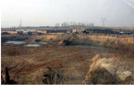
朝阳沟劳教所的砖厂前的大坑

在 2001 年至 2002 年期间，朝阳沟劳教所强迫大法学员同犯人们每天挖土运土，为砖厂造砖提供材料。分 4 组，6、7 人一组，每组中一人推一吨的翻斗车，其他人挖土，一车装近一吨半的土，最高频次一分钟一车，一天达 800 车，这个坑就是当时大法学员被强迫同犯人们挖土生成的。