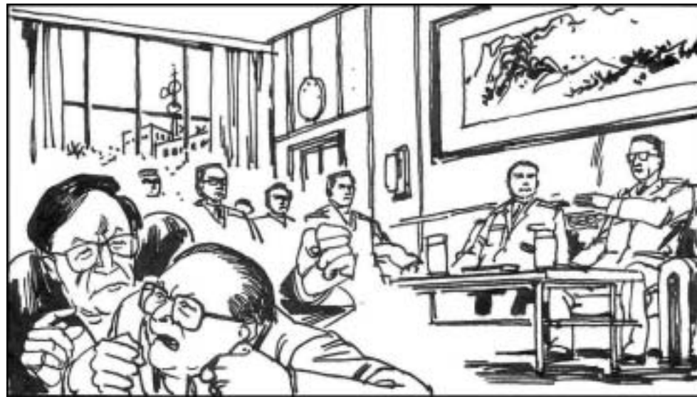
4. 1992年8月邓小平住院。杨白冰召聚了高级将领46人在北京开会讨论江是否胜任军委主席，如果邓去世军队如何继续为改革保驾护航。江泽民听说后又气又怕，曾庆红分析首先应对付杨家。