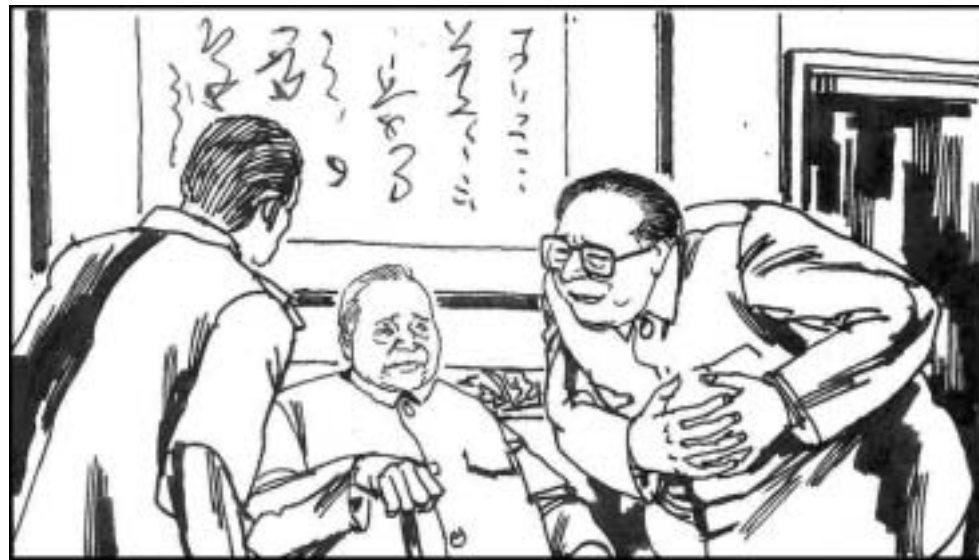
10. 江拉拢军中反杨势力，向邓小平打小报告，江泽民也一连串表示要效忠，在多方压力下，邓小平放弃了撤换江泽民之意，接受江的建议废除了杨氏兄弟的军权，举荐刘华清、张震等老军头辅佐江泽民执掌军权。