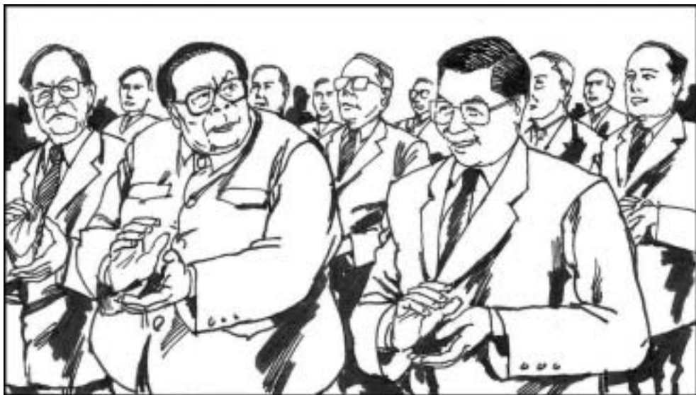
11. 邓小平仍深感江泽民靠不住。中共十四大上邓出人意外地给江泽民安排了接班人——四十九岁的胡锦涛。给接班人安排接班人，在中共历史上是前所未有的。