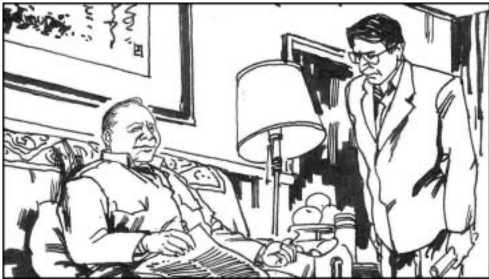
5. 杨尚昆反对“六四”开枪，江抓住这个隔阂，这次会议后一边向外面散布谣言，一边向病中的邓小平多次告“御状”，说杨氏兄弟要夺邓的权。邓派人探听，果然听到江散布的谣言，使杨氏兄弟失去了邓的信任。