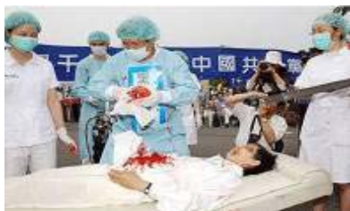
模拟中共“活摘法轮功学员器官”

2006 年 5 月 8 日加拿大资深国会议员、亚太司前司长大卫·乔高与著名国际人权律师大卫·麦塔斯举行了新闻发布会，宣布了接受邀请，并在加拿大负责对“中共活体摘取法轮功学员器官”的独立调查工作。调查计划包括：采访在美国、加拿大、欧洲等地所能找到的证