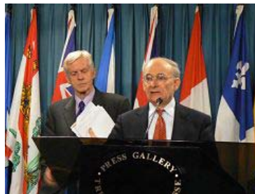
麦塔斯（讲话者）和乔高 在新闻发布会上

2006年7月6日由加拿大前亚太司司长资深国会议员大卫·乔高和国际人权律师大卫·麦塔斯组成的独立调查组，向加拿大媒体公开了“关于调查指控中共摘取法轮功学员器官的报告”。