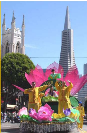
沿途观众为法轮功队伍欢呼鼓掌，游行

然是党员，却没做什么坏事，即使有神，有难，神也会保佑我的。所以不用走退党的形式。这让我想起了这个故事。