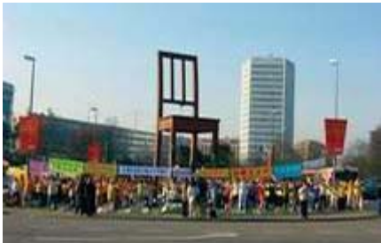
全球法轮功学员在联合国前讲真相

瑞士电讯社九月二十六日，发表题为“联合国将对中共贩卖人体器官进行调查”的报道。文章说，中共企图阻止在人权理事会上讨论“关于中共摘取法轮功修炼者人体器官的问题”，但是没有成功。这次在日内瓦举行的会议于十月六日结束。