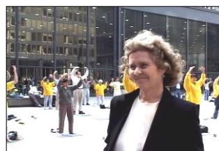
在美国起诉江泽民，律师向法院递交被告罪证