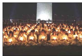
美国华盛顿烛光守夜悼同修