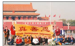
西方法轮功学员天安门请愿