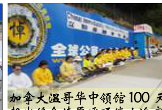
加拿大溫哥華中領館100天靜坐絕食請愿呼吁停止迫害

法轮功不是政治组织，是遵循真善忍原则的修炼团体，他们对国家权力、政治没有兴趣，从未参与政治；他们六年来所做的一切，只是以良知揭露恶党暴政而制止这场邪恶迫害，为所有人争取一个人与生俱来的做好人、自由信仰和修炼的基本权利。