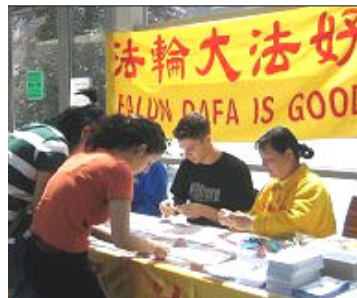
荷兰女大学生认真学习功法