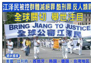
江泽民被控群體滅絕罪 酷刑罪 反人類罪 全球關注 舉世注目