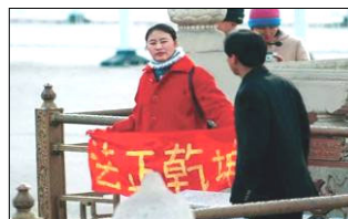
中国学员天安门和平请愿