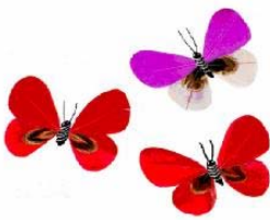
奴役大法弟子制作的出口蝴蝶

饭、洗涮、上厕所规定的时间近一个小时外，其余时间都是干活。还经常加班到晚上11、12点，早上有时4点就起来。有时上厕所的几分钟的时间里手里都拿着活干。因为有的是羽毛活儿，羽毛是由各种颜色染的，羽毛被呼吸到气管里，流出的鼻涕都带有羽毛的颜色。有的羽毛发出很难闻的气味。有时就得戴上口罩。还有一种叫做划模的活，是用铁钩高温下烫，干这种活的时候，我们全身都得包好，只露出一双眼睛，烫模时冒出的毒烟一会就把我们熏得全身都是黑的，流出的鼻涕、吐出的痰都是黑的。这种活经常干，而且一干就是一两天，严重的毒害着学员的身体。