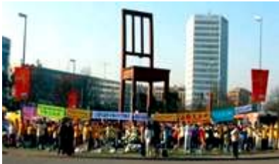
来自全球的法轮功学员 在联合国前炼功、讲真相