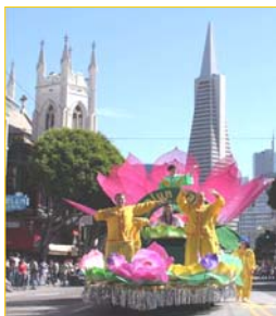
花车上演示法轮功功法

法轮功队伍以天国乐团打头阵，演奏了“法轮大法好”等乐曲，随后是花车、炼功队及明慧学校小弟子表演的剑舞。沿途观众有的跟着乐团吹奏的乐曲，和着拍子而舞动，有的欢呼鼓掌，有的在学法轮功学员的炼功动作。游行组委说：“旧金山的每个游行活动，都应邀请法轮功参加，法轮功是不可缺少的团体。”