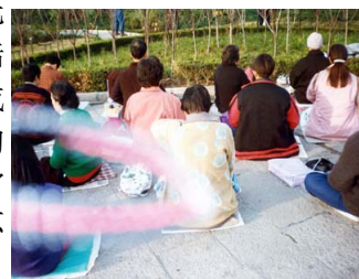
能量场——法轮功学员 炼功时拍到的奇妙景象

就拿我的身体变化来说吧，我没吃任何药，就靠修炼法轮功病就好了。不光我这样，我认识的中国大陆许多法轮功学员中，甚至成千上万的人都重复了我的经历，这不就是真实而超常的“群体现象”吗？这不正是人类最值得进一步去探索的超常的科学吗？