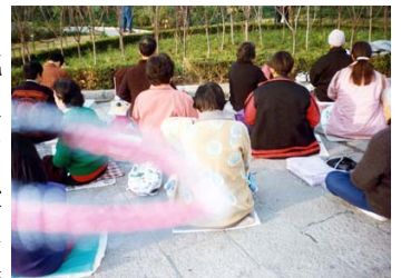
能量场——法轮功学员炼功时拍到的奇妙景象

法轮功在人的精神境界方面带给修炼者的变化也很大。当时我身边的朋友、学生、同事都发现我的世界观、为人处事、工作方法等都改变了。比如我刚当院长后，由于年轻气盛、主观武断，和领导班子一些成员关系比较紧张。后来学习了《转法轮》中“业力的转化”、